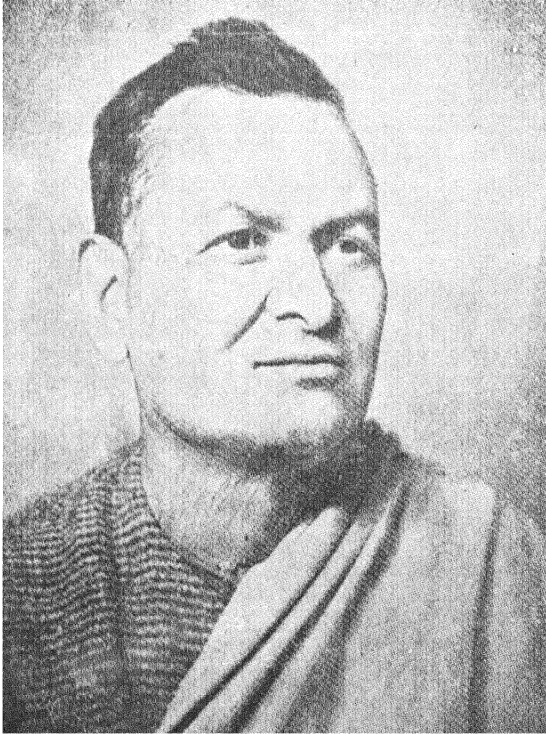
स्वर्गीय महापण्डित राहुल सांकृत्यायन